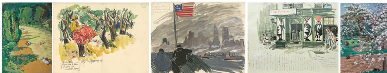
----- Visuels exposition temporaire -----