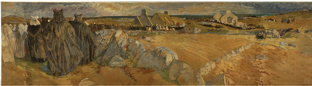
Mathurin Méheut, L'été, le Pardon, 1913 , Gouache sur papier maroufflé sur toile, 550 x 150 cm FNAC 4687 Centre national des arts plastiques, Dépôt au musées des beaux-arts de Rennes