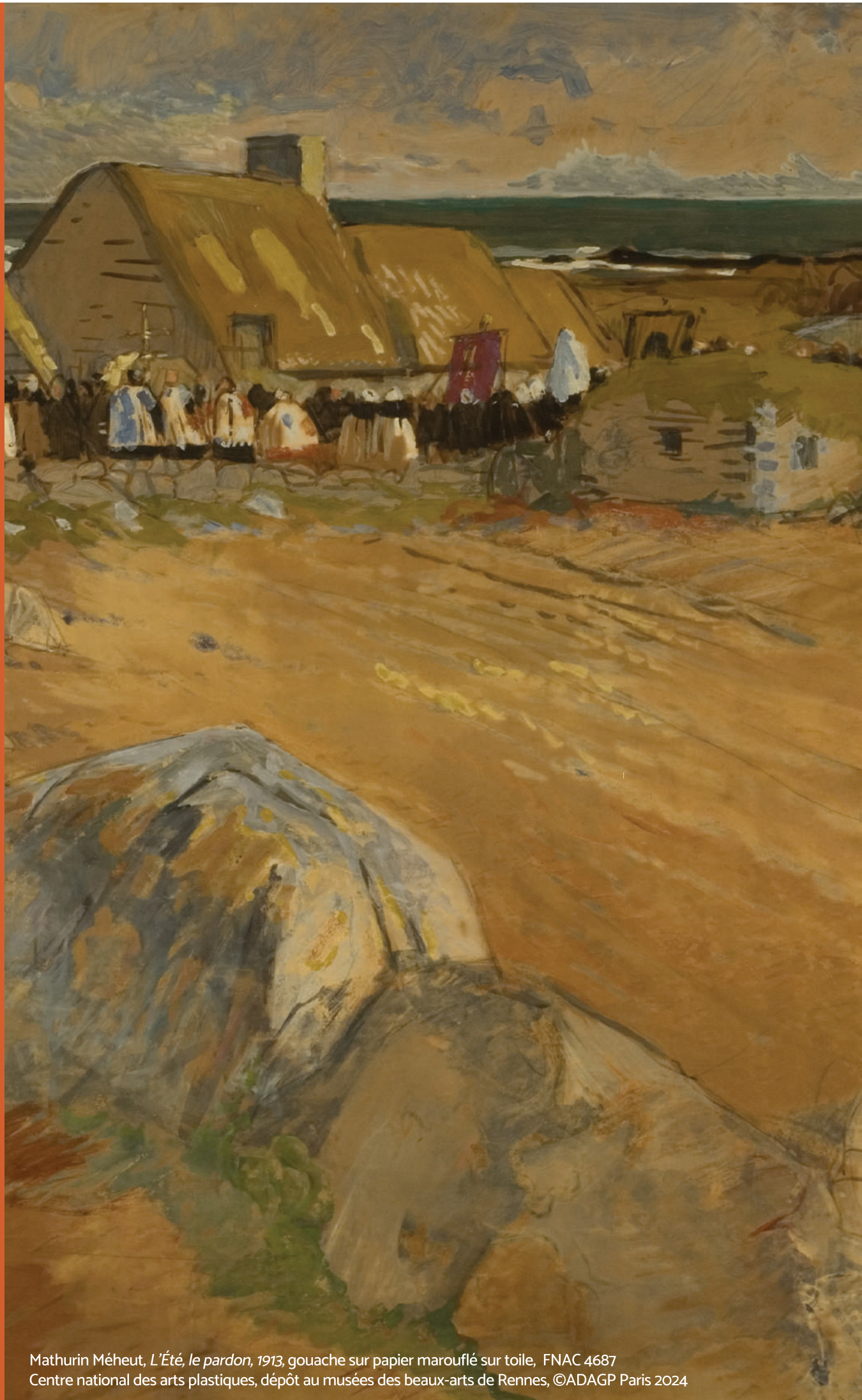
Mathurin Méheut, L'Été, le pardon , 1913, gouache sur papier maroufflé sur toile, FNAC 4687 Centre national des arts plastiques, dépôt au musées des beaux-arts de Rennes, ©ADAGP Paris 2024