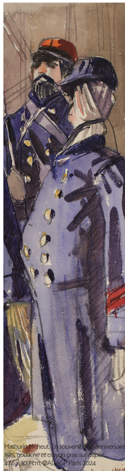
Mathurin Méheut, En souvenir d'un anniversaire 1915 , gouache et crayon gras sur papier, 47,6 x 30,7 cm, ©ADAGP Paris 2024

Le pardon est une tradition très ancrée dans la culture populaire en Bretagne. Il s'agit d'une forme de pèlerinage organisé à date fixe, dans un lieu déterminé et dédié à un saint protecteur. Il comporte une messe et une procession en extérieur vers un lieu sacré. Mathurin Méheut choisit de représenter le moment de la procession dans une composition originale qui place le spectateur derrière et à distance du cortège créant une spectaculaire perspective. L'œuvre est à découvrir du 6 avril 2024 au 5 janvier 2025.