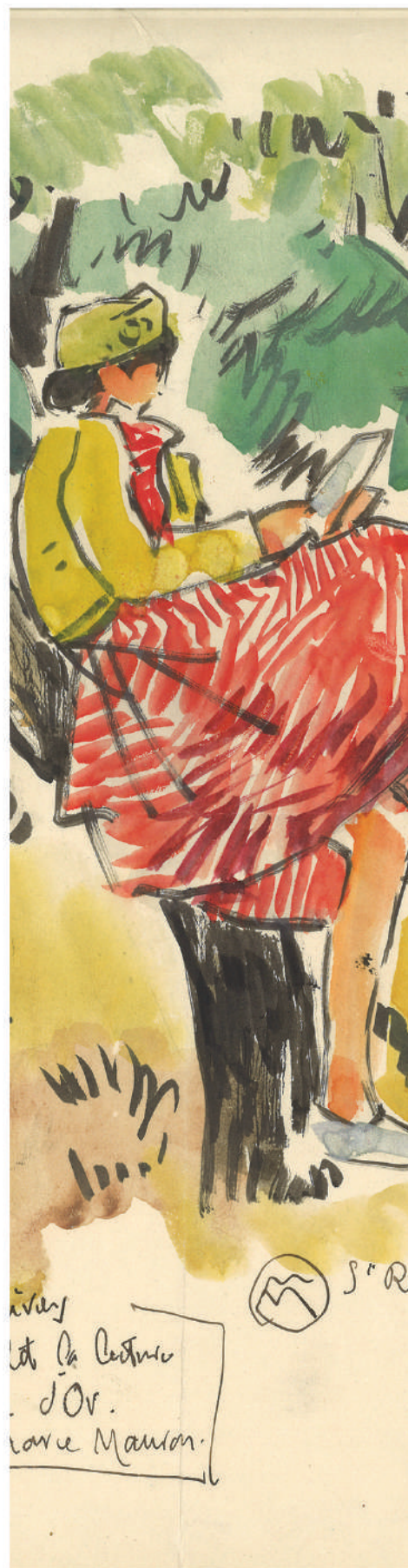
Dans les oliviers, 1951, lettre, gouache sur papier, 40 x 31 cm

Un partenariat a donc été ouvert entre le musée Yvonne Jean-Haffen à Dinan et Mathurin Méheut à Lamballe : une entrée achetée dans l'un des musées permet de bénéficier du tarif réduit dans l'autre.