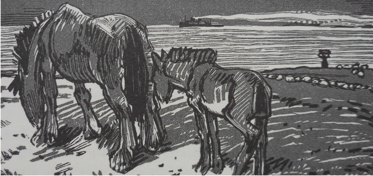
Mathurin Méheut, illustration page 157 du livre Le gardien du feu d'Anatole le Bras, musée Mathurin Méheut. © ADAGP, Paris, 2017.

« Une aube brouillée, une mer baveuse. La fumée d'un transatlantique à l'horizon. Il y a donc des gens qui voyagent, qui vont vers un but, vers un désir, vers un rêve ?... Je me suis assoupi quelques instants. Ça, où en étais-je ? ... Ah ! Parfaitement ! ... La route de la caserne sous les étoiles... Il y en avait cette nuit-là, par myriades* . Et toutes, même les plus lointaines brillaient d'un éclat insolent, d'un éclat cruel. J'aurais souhaité de pouvoir les éteindre d'un coup et rendre le monde à l'obscurité primitive, aux ténèbres d'avant la vie. J'avais en moi une haine sans bornes et qui s'étendait à l'univers entier ; mais c'était maintenant une haine calme, froide, résolue ».