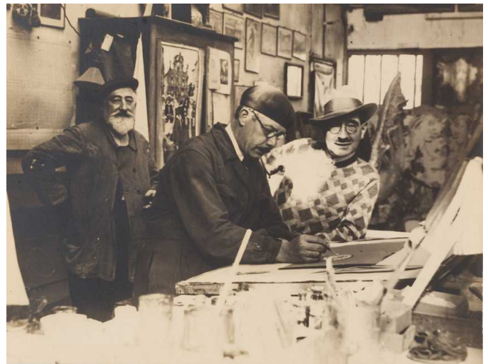
Mathurin Méheut chez le lithographe, photographie archives musée Mathurin Méheut.