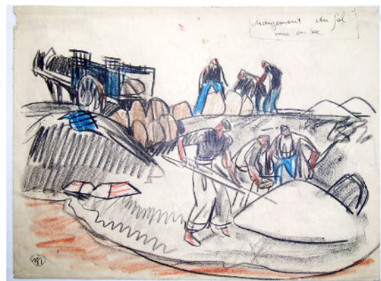
Mathurin Méheut, Chargement du sel, mise en sac , © ADAGP, Paris 2023.

Que récupèrent les personnages ? Quel est le nom de leur métier ?