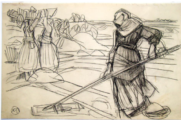
Mathurin Méheut, La cueillette du sel , © ADAGP, Paris 2023.

Observe les deux oeuvres ci-dessous qui font référence au même métier et réponds aux questions.