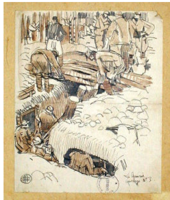
Mathurin Méheut, La Grurie , © ADAGP, Paris 2023.