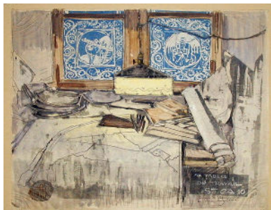
Mathurin Méheut, Ma table de travail pendant l'attaque sur Chaulnes , © ADAGP, Paris 2023.