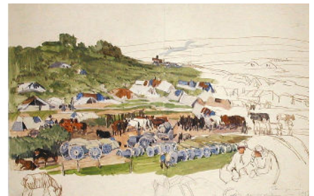
Mathurin Méheut, Camp derrière Verdun, 1917 , © ADAGP, Paris 2023.