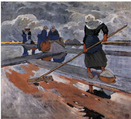
Mathurin Méheut, Les ramasseuses de sel à Guérande , © ADAGP, Paris 2024.

Observe les deux oeuvres ci-dessous qui font référence au même métier et réponds aux questions.