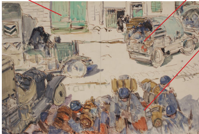
Mathurin Méheut, «La 19e D.I. s'en va !», © ADAGP, Paris 2024.

Qu'est ce qui est représenté au premier plan ? Décris brièvement ce qui se passe.