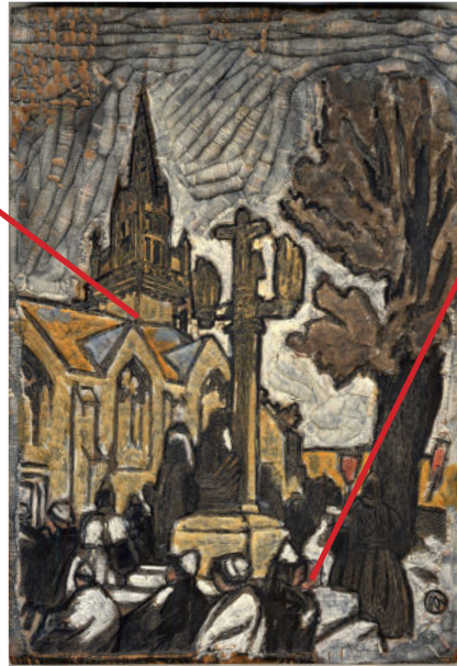
Mathurin Méheut, «Bois gravé «Calvaire» », © ADAGP, Paris 2024.